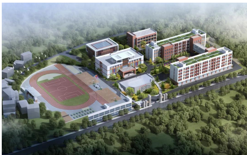
岚皋县第四小学项目鸟瞰图

该项目位于安康市岚皋县城关镇城关村二组（小地名：朱家台子），计划工期：600日历天。主要建筑内容包括教学楼、教辅楼，教师宿舍楼、办公楼、餐厅楼、风雨操场，并配套建设辅助设施及室外场地绿化硬化等，项目总用地面积 27340 平方米，总建筑面积 16000 平方米。