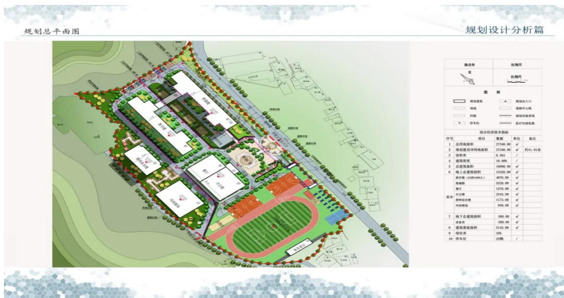
岚皋县第四小学项目规划设计图

岚皋县第四小学建设项目是当地政府高度重视的一项民生工程，项目建成后，将进一步提升校园硬件设施，改善校园环境，为全校师生提供更加优良的学习和工作环境，为当地教育高质量发展提供有效保障。